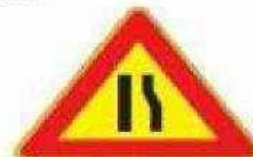
Figura II 386 Art. 31