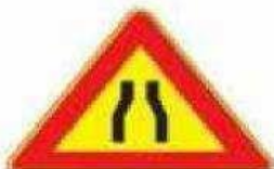
Figura II 384 Art. 31