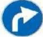
Figura 1 80/a Art. 122 PREAVVISO DI DIREZIONE OBBLIGATORIA A DESTRA