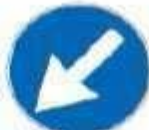
Figura 1 82/a Art. 122 PASSAGGIO OBBLIGATORIO A SINISTRA