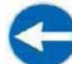
Figura 1 80/b Art. 122 DIREZIONE OBBLIGATORIA A SINISTRA