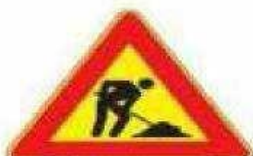
Figura II 383 Art. 31