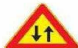
Figura II 387 Art. 31

Segnali comunemente utilizzati per la segnalica temporanea