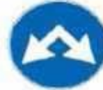
Figura 1 83 Art. 122 PASSAGGI CONSENTITI