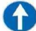
Figura 1 84/a Art. 122 DIREZIONE OBBLIGATORIA DIRITTO