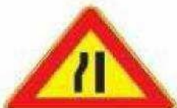
Figura II 385 Art. 31