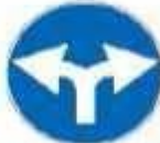
Figura 1 81/a Art. 122 DIREZIONI CONSENTITE DESTRA E SINISTRA