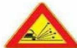
Figura II 390 Art. 31