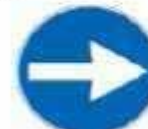
Figura 1 80/c Art. 122 DIREZIONE OBBLIGATORIA A DESTRA