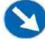
Figura 1 82/b Art. 122 PASSAGGIO OBBLIGATORIO A DESTRA