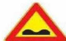
Figura II 389 Art. 31