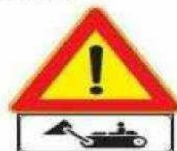
Figura II 388 Art. 31